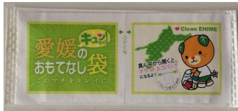
オリジナルデザインによる使用事例